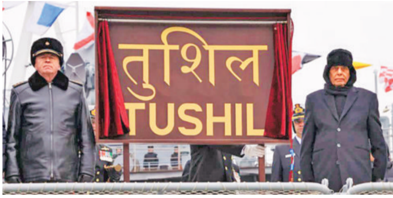
Union Defence Minister Rajnath Singh during the commissioning ceremony of INS Tushil in Russia's Kaliningrad on Monday

"The ship is a big proof of the collaborative prowess of Russian and Indian